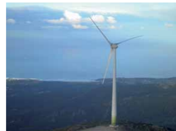
ENERCON E-82 E4 am Standort Porto do Son in Galizien.

Die E-82 E4 in Spanien entstanden bei den Ortschaften Porto do Son und Pobra do Caraminhal in Galizien im Nordwesten des Landes. Beide sind wie Ballycadden Windklasse-I-Standorte und befinden sich nahe der Atlantikküste. Je eine E-82 E4 mit 84 Meter Nabenhöhe wurde in Porto do Son und in Pobra do Caraminhal errichtet. Bei beiden Projekten handelt es sich um Gemeindeprojekte. 📧