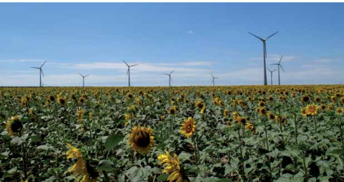
Windpark Casimcea in Rumänien mit ENERCON E-82 E2.