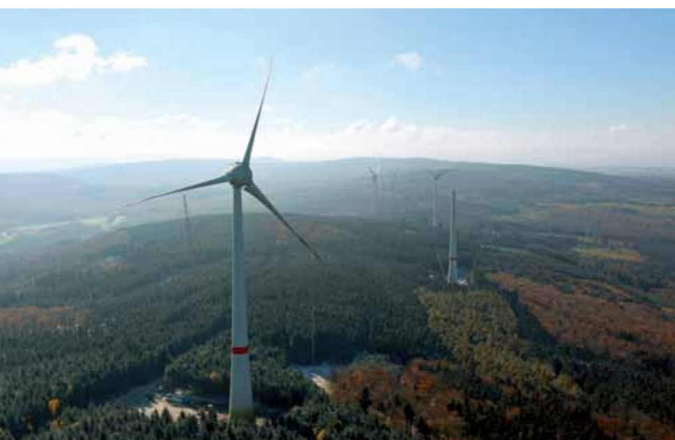
Erstklassiger Mittelgebirgsstandort: Die Erträge der fünf ENERCON E-126 im Windpark Ellern sind vergleichbar mit denen von Anlagen an der Küste.