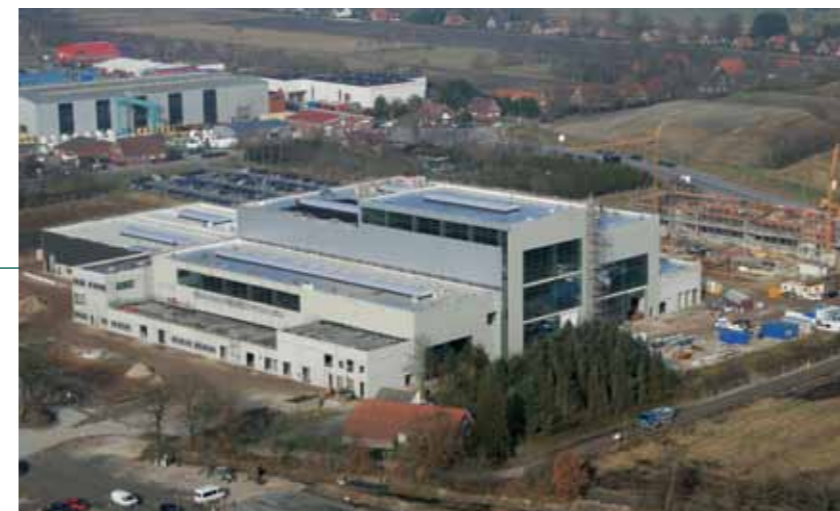
Versuchshallen errichtet: Im Sommer soll in ENERCONs neuem Innovationszentrum der Testbetrieb starten. Die Bürogebäude sollen bis Jahresende bezugsfertig sein.

Nach oben zeigten die Aufbauzahlen 2012 für ENERCON – der Hersteller verzeichnete das beste Installationsjahr seiner Geschichte. Im Bild: ENERCON E-126 in Hamburg.