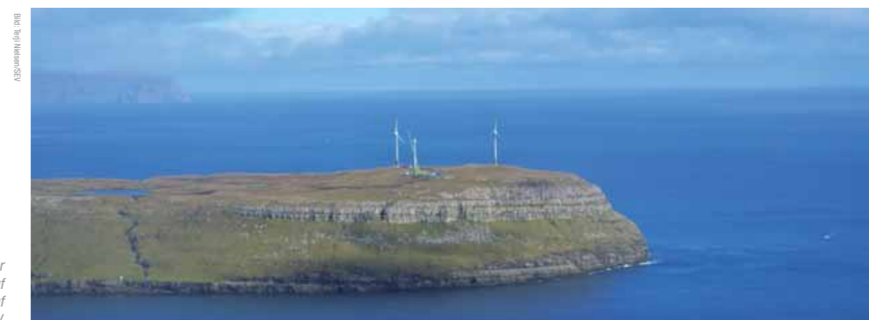
Beeindruckender Standort: Neshagi auf den Färöer Inseln mit fünf ENERCON E-44/900 kW.