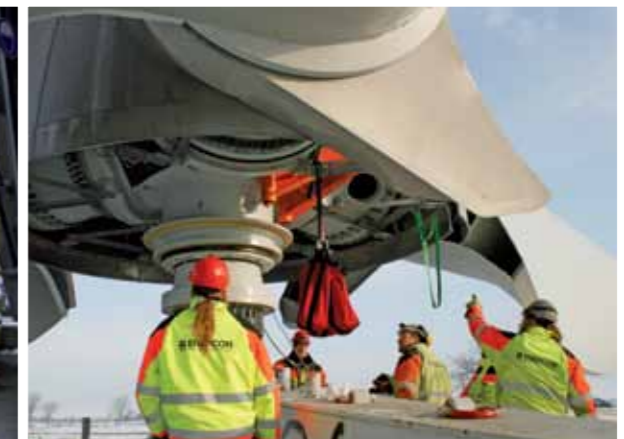
Verladung der für den E-92 Prototyp bestimmten Rotorblätter am Logistikplatz in Aurich (links). Letzte Vorbereitungen für den Nabenzug (mitte). Bild rechts: Der E-92 Prototyp ist errichtet.