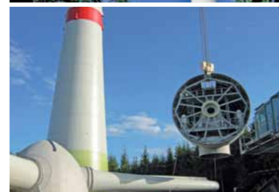
Errichtung der ENERCON E-126/7,5 MW im Windpark Ellern. Die Aufbautteams installierten die Turbinen in Rekordzeit.

wurden sie dann, wenn sie benötigt wurden, mit ENERCON eigenen Fahrzeugen zu ihrem Aufbauort im Windpark transportiert», sagt Bas.