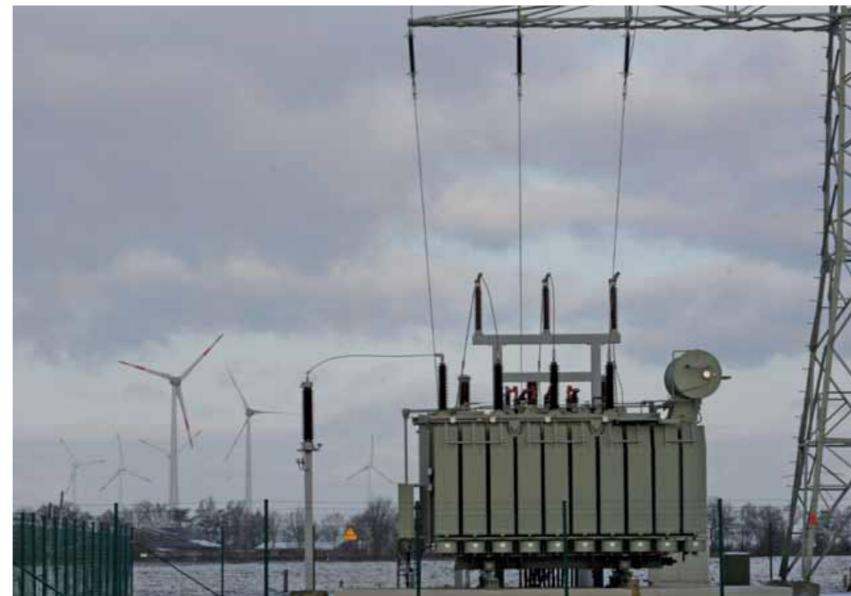
Trübe Aussichten: Die von der Bundesregierung vorgeschlagenen Sparmaßnahmen bei der Erneuerbaren-Förderung führen zu großer Verunsicherung der gesamten Branche.

Ein kompletter Systemwechsel hin zu dezentraler, sauberer und auf Dauer günstiger Energie kostet Geld. Gemessen an den bisherigen Ausgaben für den fossil-atomaren Kraftwerkspark sind diese reinen Investitionskosten aber vergleichsweise klein. Und im Gegensatz zum fossilen Kraftwerkspark wird der erneuerbare Strom auf Dauer günstiger, denn Erneuerbare Energien benötigen keine Brennstoffe. Derzeit profitieren die alten konventionellen Kraftwerke davon, dass die Investitionen lange abgeschlossen sind. Kostenfaktor sind ausschließlich die Brennstoffe und die Wartung. Externe Kosten werden komplett auf die Allgemeinheit abgewälzt. Umwelt- und Gesundheitsschäden, atomare Endlagerung, Atomtransporte sowie die Folgen des Klimawandels zahlen heute und künftig lebende Menschen. Das Verschenken von Emissionszertifikaten im europäischen Emis-