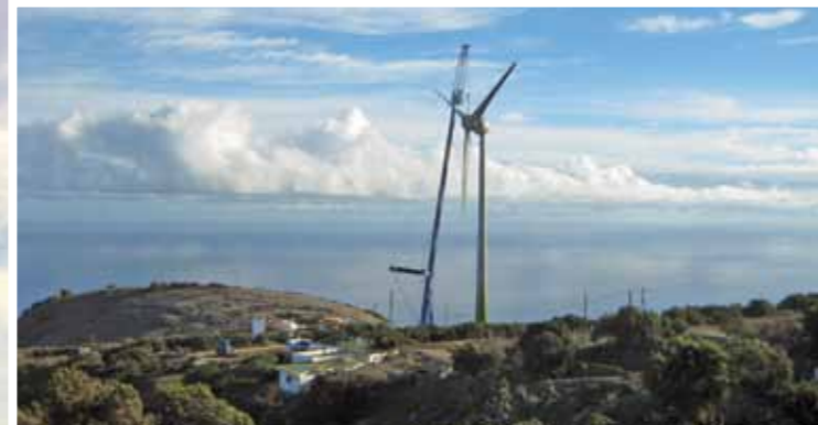
ENERCON E-70 Aufbau bei Arinaga auf Gran Canaria (links). Bild oben: Nabenzug einer ENERCON E-48 bei Garafia auf La Palma.