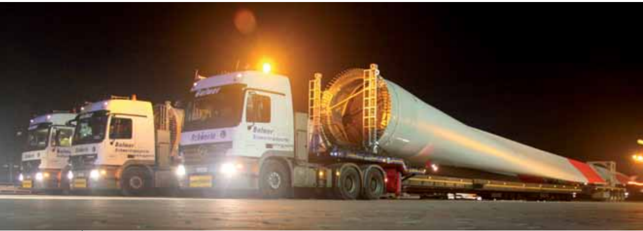
Abfahrt bei Nacht: Der erste E-101 Blatttransport aus der KTA in Aurich Ende November.