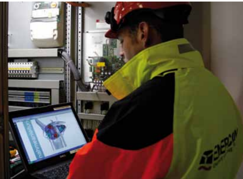
Schneller Informationsfluss: Was der ENERCON Service beim Wartungstermin vor Ort protokolliert, fließt gleich ins neue SIP mit ein.