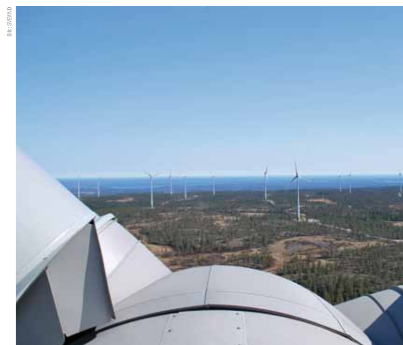
Der Windpark Gabrielsberget Syd ist nur rund zehn Kilometer von der Ostsee entfernt.

Die Einweihung des ersten Bauabschnitts feierten ENERCON und SVEVIND mit geladenen Gästen und Besuchern aus der Region als Tag des offenen Windparks. Viele Anwohner waren gekommen, um sich vor Ort über das Windpark-Projekt zu informieren. Derweil sind bereits die Bauarbeiten für den zweiten Bauabschnitt angelaufen. Noch in diesem Jahr sollen die ersten fünf E-82 Anlagen von Gabrielsberget Nord errichtet werden. Die restlichen Anlagen folgen dann im ersten Halbjahr 2012.