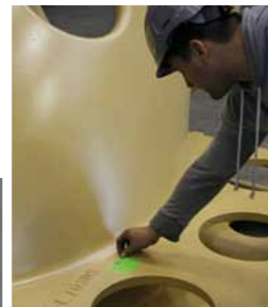
Abschließende Ultraschallprüfung an einem Maschinenträger. Sind die Prüfergebnisse ohne Beanstandung, erhält das Bauteil einen grünen Freigabe-Aufkleber (Bild oben).

Vor der Auslieferung einer Gusskomponente prüfen Mitarbeiter der Qualitätssicherung dann noch einmal die Oberflächenbeschaffenheit und die Wandstärke jedes Bauteils. Wegen des hohen Qualitätsstandards und des gut funktionierenden Überwachungssystems ist es dabei eigentlich nur noch Formsache, einen kleinen grünen Aufkleber anzubringen. 🟢