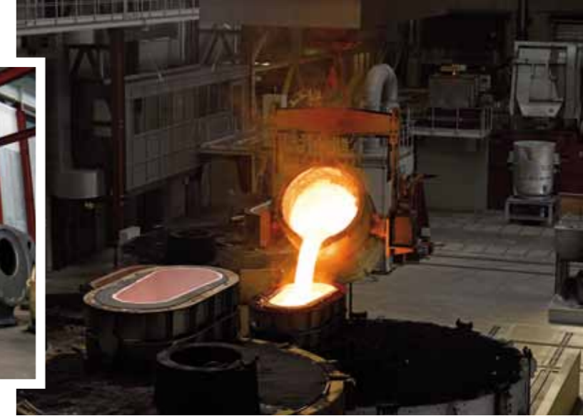
Im GZO Gusszentrum Ostfriesland lief erst vor einem Jahr die Serienfertigung an.