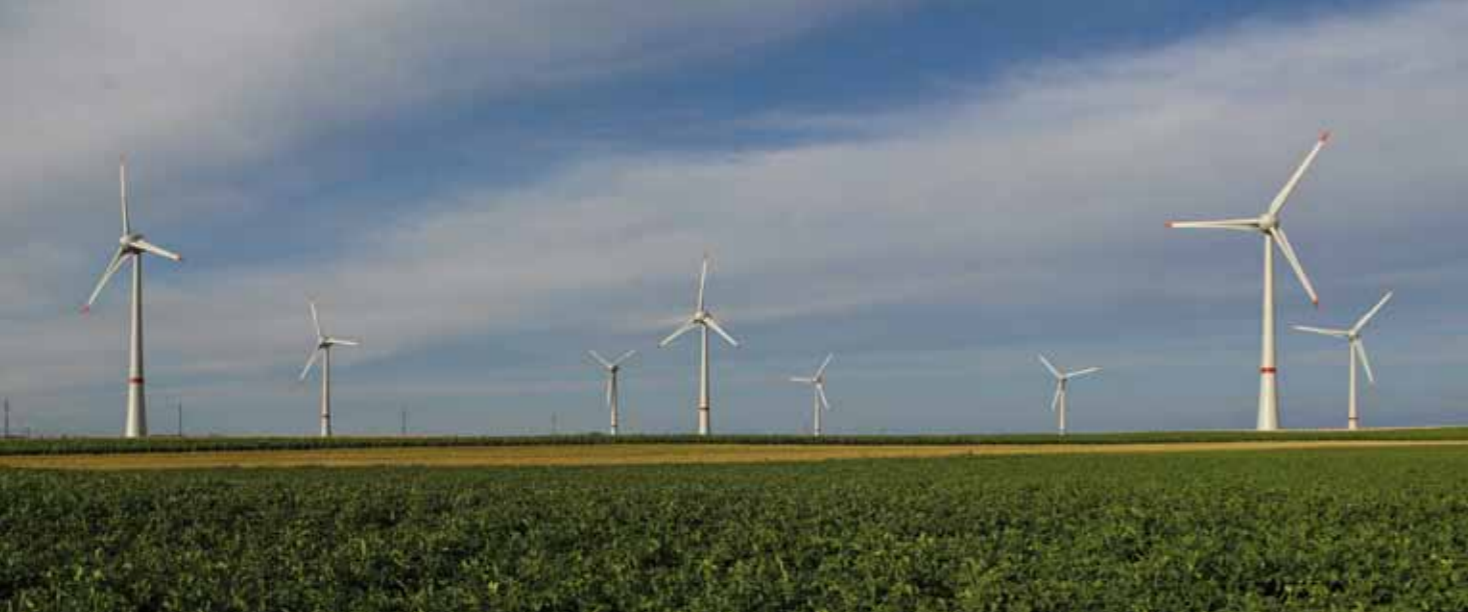
E-126 Windpark in Estinnes, Belgien.