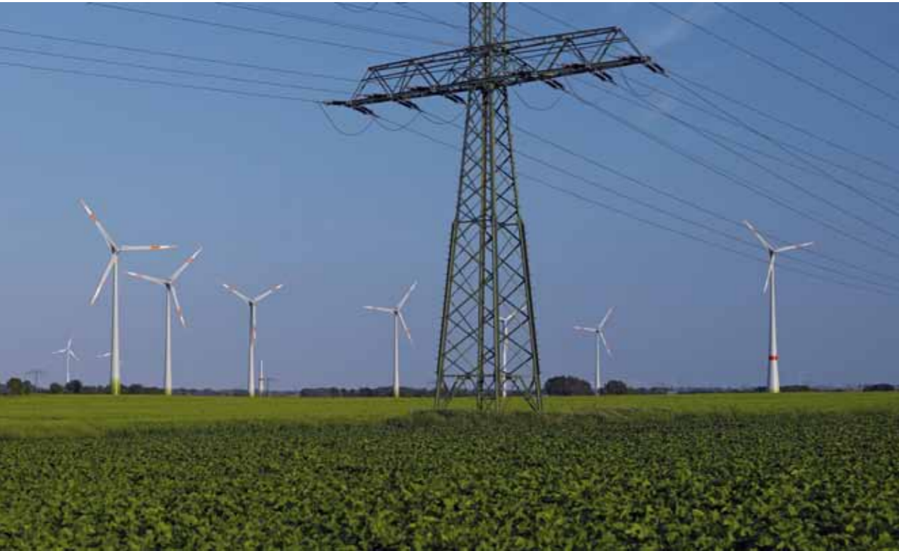
Das neue Energiepaket ermöglicht der Windenergie an Land, den geplanten Löwenanteil der Energiewende zu erbringen.