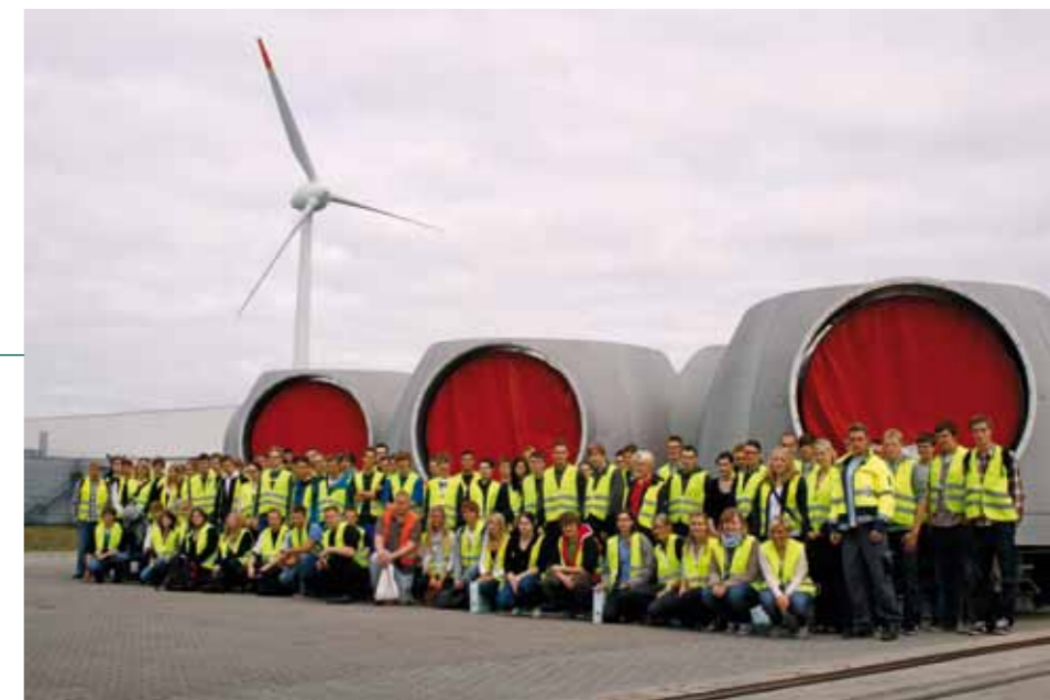
Erster Arbeitstag bei ENERCON: Die 91 neuen Auszubildenden erhielten zum Ausbildungsstart eine Werksführung.

ENERCON legt großen Wert auf die qualifizierte Ausbildung eigener Fachkräfte. Für den Windenergieanlagenhersteller ist sie ein wichtiges Instrument für die Rekrutierung neuer Mitarbeiter – nicht zuletzt vor dem Hintergrund der weitergehenden Unternehmensexpansion. Für die neuen Auszubildenden ergibt sich dadurch eine erfreuliche Perspektive: So sind die Übernahmemöglichkeiten in ein festes Beschäftigungsverhältnis nach erfolgreich absolvierter Berufsausbildung bei ENERCON derzeit sehr gut.