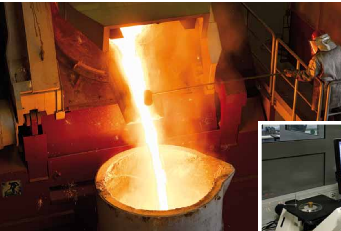
Bild unten: Mikroskopische Analyse und Auswertung der Gussprobe am Computer.

Nur wenn die Schmelze exakt der geforderten Zusammensetzung entspricht, wird im GZO ein Gussvorgang gestartet.